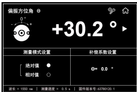
图E. 偏振方位角测量与设置