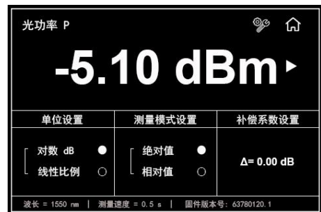
图D. 光功率测量与设置