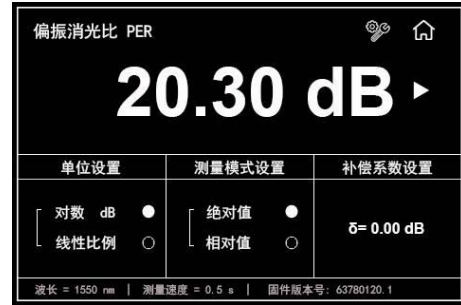
图B. 偏振消光比测量与设置